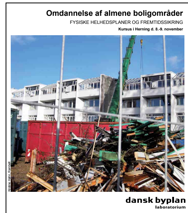
Kursusindbydelse fra Byplanlaboratoriet

Sidste år tog BL i samarbejde med AlmenNet initiativ til et nyt kursustilbud for organisationsbestyrelser. BL's kursus er en komprimeret udgave af Byplanlaboratoriets og formålet er at give mere viden om processer, rollefordeling og strategiske overvejelser i forbindelse med fremtidssikring og renovering. Igen i år blev kurset afholdt på Haraldskær i Vejle, og vi benyttede lejligheden til at se den store renovering af AAB's Finlandsparken i 1:1. På kurset deltog 25 beboervalgte. Information om næste kursus vil blive annonceret på vores hjemmeside.