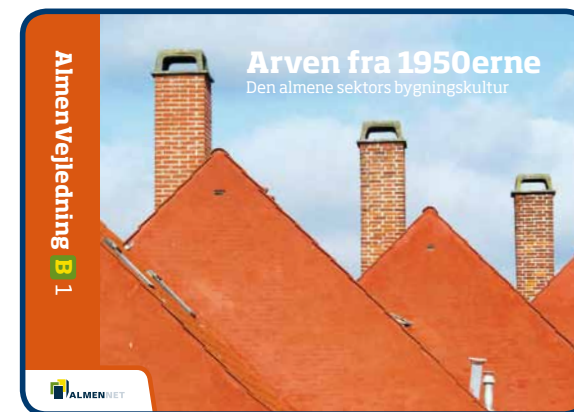
Vejledning om bygningskultur for almene boliger

I dette udviklingsarbejde er der blevet sat fokus på bevaringsværdier og bygningskultur i forbindelse med renoveringer af 50'ers byggerierne. Projektet er færdiggjort i år med en flot publikation som resultat. Boliggården (Helsingør) har været projektleder og Landsbyggefonden sponsor.