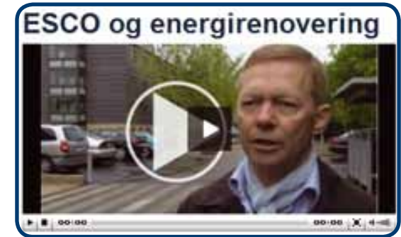
Se video på www.almennet.dk

Video'er på AlmenNets hjemmeside er et andet tiltag, hvor vi forsøger at hæve overliggende for formidling af foreningens aktiviteter og dermed skabe nye og andre veje til vidensspredning. Foreløbig er det afprøvet i begrænset omfang, men de positive tilbagemeldinger betyder, at vi fremover i stigende grad vil benytte videomediet i foreningens kommunikation – gerne i en kombination med artikler og multimedie-præsentationer. Video'er på hjemmesiden er sandsynligvis en af forklaringerne på, at trafikken på www.almennet.dk er vokset med 40 %.