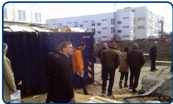
Gå-hjem-møde på Amager

I år er der afholdt rekord mange foreningsarrangementer og flere nye tiltag.