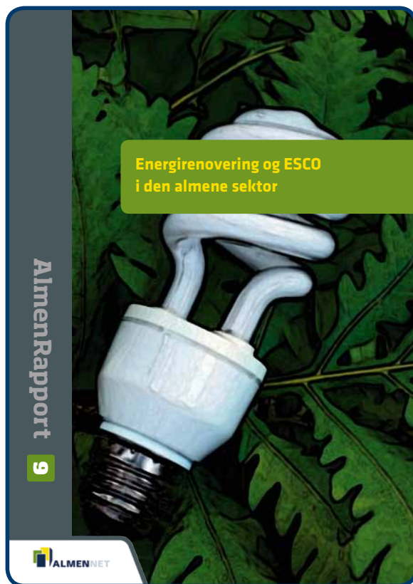
Rapport om ESCO i den almene sektor

Arbejdet er nu afsluttet med en interessant rapport. Projektleder har været Bo-Vest og arbejdet er udført med støtte fra Landsbyggefonden.